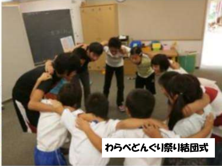
わらべどんぐり祭り結団式