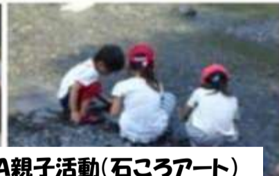
PTA親子活動(石ころアート)