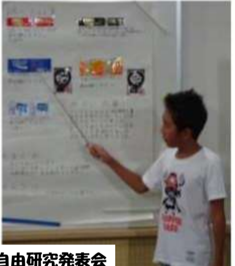
夏休み理科自由研究発表会