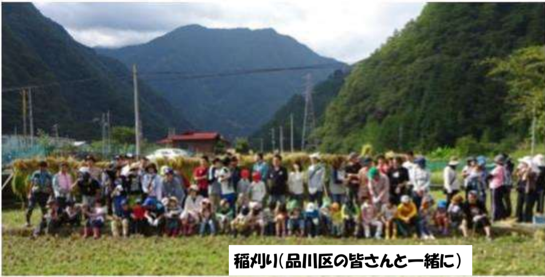
稲刈り(品川区の皆さんと一緒に)